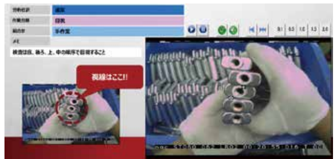
メッキ加工の目視検査：動画教育マニュアル