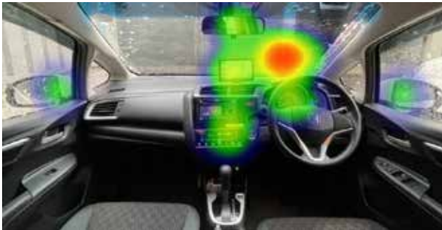
運転時：ヒートマップ解析（注視していた場所）

注視時間や瞳孔径を基準に閾値を設けて解析、画像マッチング機能で「関心」があったものを自動で抽出、AOI 分析機能などができるようになりました。