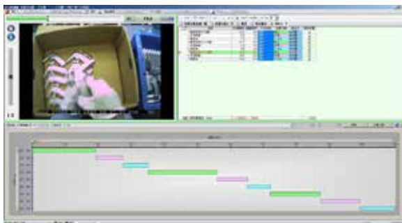
標準作業組合票を自動出力

技能伝承向けの解析ソフト『タイムプリズム』は EMR-10 の動画を取り込めます。熟練作業者の無意識なコツを探し出し教育マニュアルを作成することや、作業効率の改善のためにボトルネックとなっている作業を発見することが可能です。