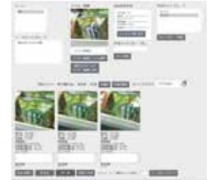
技能伝承：画像マッチング